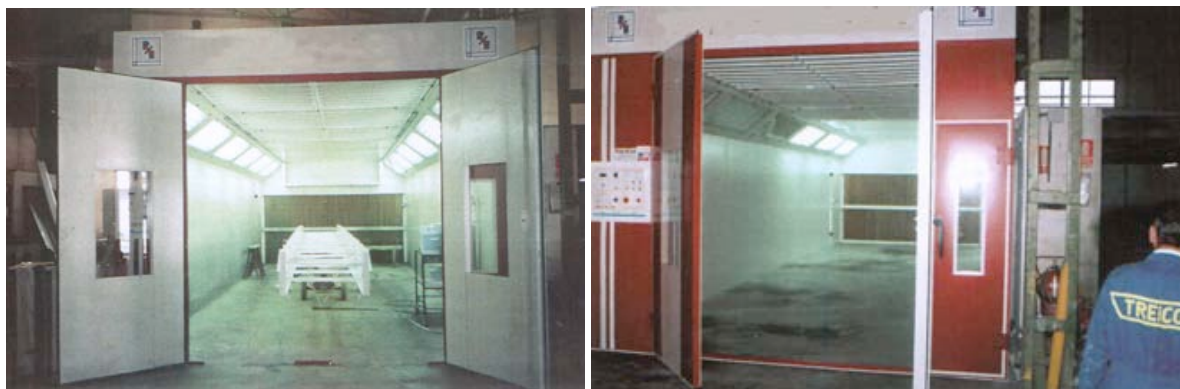
Ingeniería de Cintas SA Cabinas (2) para pintado y secado de estructuras de cintas transportadoras TREYCO Dimensiones 15x4,5x3 metros de alto

Dimensiones mínimas de Cabinas para Pintado y Secado que podemos ofrecerles: Largo útil 6,45 metros Ancho útil 4 metros Largo 4 - 6 - 8 - 10 - 12 - ... metros