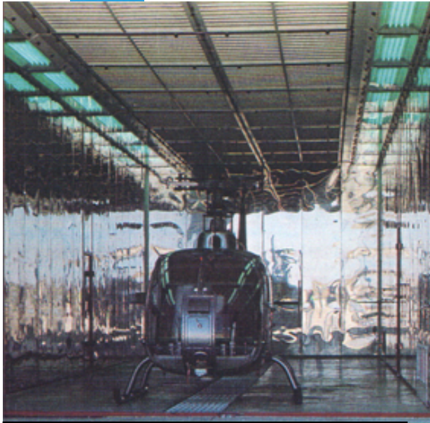
Recinto para lavado, decapado, enjuagado y secado de helicópteros.